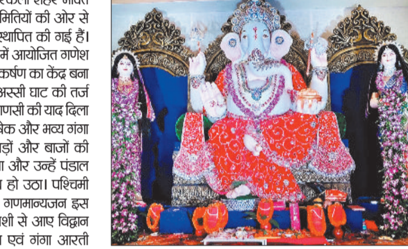
गणेश प्रतिमा की भी पूजा-अर्चना की गई। आरती के बाद समिति की ओर से प्रसाद वितरण और मेले का आयोजन किया गया, जिसमें भक्तों की मरी भौड़ उमड़ पड़ी।

राउरकेला। गणेश पूजा के अवसर पर राउरकेला शहर भक्ति और उत्साह से सराबोर है। जगह-जगह समितियों की ओर से आकर्षक पंडाल और भव्य गणेश प्रतिमाएं स्थापित की गई हैं। इसी कड़ी में सविल टाउनशिप के मध्य भाग में आयोजित गणेश उत्सव इस बार श्रद्धालुओं के लिए विशेष आकर्षण का केंद्र बना हुआ है। यहां पंडाल को काशी के विख्यात अस्सी घाट की तर्ज पर सजाया गया है, जिसमें श्रद्धालुओं को वाराणसी की याद दिला दी। पहले ही दिन पंडाल में गंगाजल से अभिषेक और भव्य गंगा आरती का आयोजन किया गया। दोल-नगाड़ी और बाजों की गूंज के बीच जब अतिथियों का स्वागत हुआ और उन्हें पंडाल तक ले जाया गया, तो पूरा माहौल भक्तिमय हो उठा। पश्चिमी आंचल डीआईजी बुजेश राय सहित अनेक गणमान्यजन इस अवसर पर उपस्थित रहें। विशेष रूप से काशी से आए विद्वान पंडितों ने विधि-विधान के साथ पूजा-अर्चना एवं गंगा आरती संपन्न कराई। इस दौरान उपस्थित श्रद्धालु धार्मिक और सांस्कृतिक उत्साह से सराबोर हो उठे। पूजा स्थल पर रायपुर (खंतीसगढ़) के प्रसिद्ध मूर्तिकार पिन घोष द्वारा निर्मित विशाल