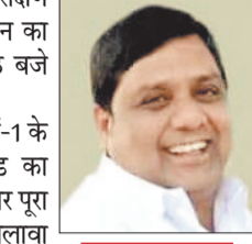
15 दिन में शोड निर्माण पूरा करने के निर्देश