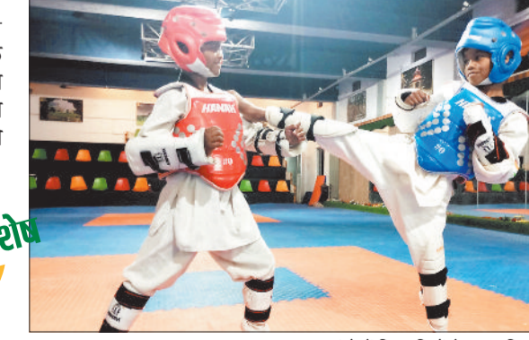
ताईक्वांडो में खिलाड़ियों ने रवा इतिहास।

आदिवासी बाहुल्य जशपुर जिले के खिलाड़ियों ने अपने मेहनत और प्रतिभा से छत्तीसगढ़ से राष्ट्रीय स्तर तक प्रतिभा की चमक बिखेरी है। खिलाड़ियों ने तीरंदाजी,ताईक्वांडो और तैराकी में गोल्ड मेडल जीत कर राष्ट्रीय स्तर के खेल प्रतिस्पर्धाओं में जगह बनाने में सफलता हासिल की। सफलता से उत्साहित इन खिलाड़ियों और उनके कोच की निगाहें अब राष्ट्रीय टीम में जगह बना कर अंतर्राष्ट्री प्रतियोगिताओं में चमक बिखरने की है।