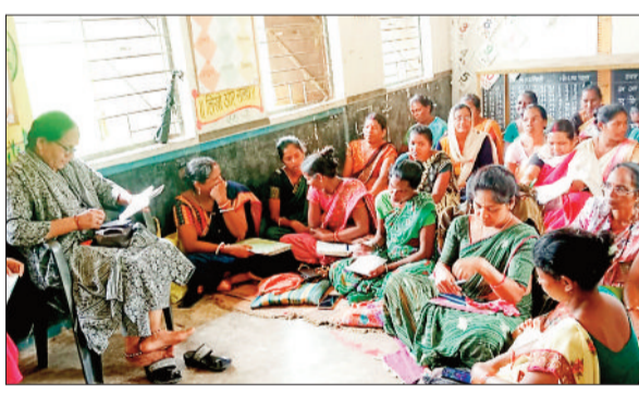
पोषण आहार मेला में जानकारी प्राप्त करती महिलाएं।

जशपुरनगर। छत्तीसगढ़ रजत महोत्सव के अवसर पर महिला बाल विकास विभाग के आंगनवाड़ी केंद्रों में पोषण मेला, महिला जागृति शिविर, बाल मेला, प्रधानमंत्री मातृ वंदना योजना के रजिस्ट्रेशन कार्यक्रम का आयोजन किया गया। इस अवसर पर परियोजना पथलगांव के सेक्टर कार्मीटिकरा के आंगनवाड़ी केंद्र पकरीढाप में बाल मेला का आयोजन किया गया। जिसमें बच्चों के द्वारा चित्र निर्माण, छोटा बड़ा अक्षर पहचान प्रतियोगिता का आयोजन हुआ। इसके अतिरिक्त विभिन्न खेलकूद एवं खिलौना निर्माण भी किया गया। इसमें आंगनवाड़ी के बच्चों ने बढ़चढ़ कर हिस्सा लिया। इसी प्रकार पुरानिवबंध सेक्टर में बैठक