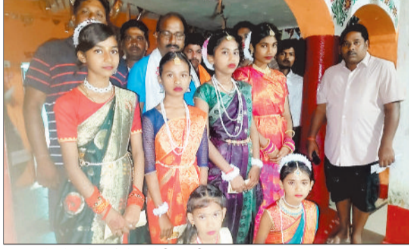
लिटिल चैंप में नन्हें बच्चों ने बिखेरी अपनी प्रतिभा।

ग्रामीण अंचल में इस वर्ष श्री गणेश महोत्सव बड़े ही उत्साह और श्रद्धा के साथ मनाया जा रहा है। नव युवक श्री गणेश पूजन समिति, गरियादोहर द्वारा आयोजित इस महोत्सव में जहां सुबह-शाम भक्ति गीतों और आरती से वातावरण भक्तिमय बना हुआ है, वहीं शाम को आयोजित होने वाले सांस्कृतिक कार्यक्रमों में ग्रामीणजन और बच्चे अपनी प्रतिभा का प्रदर्शन कर रहे हैं।